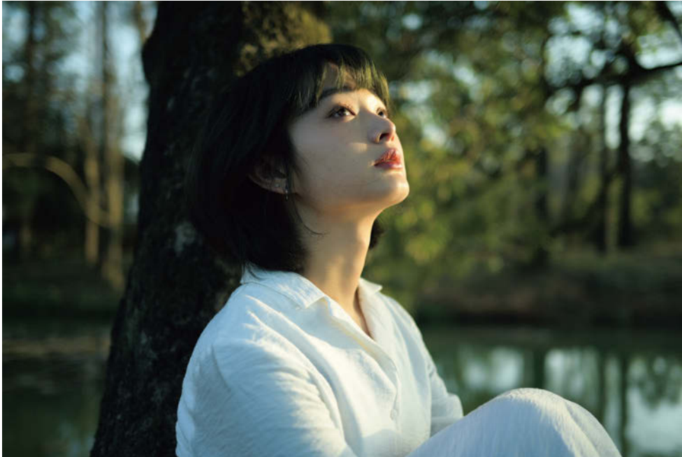
Z 5, NIKKOR Z 40mm f/2