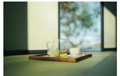
Z 5, NIKKOR Z 40mm f/2