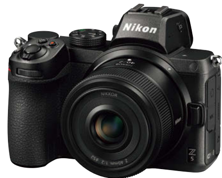
Z5 + NIKKOR Z 40mm f/2