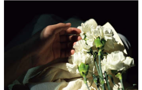
Z 5, NIKKOR Z 40mm f/2