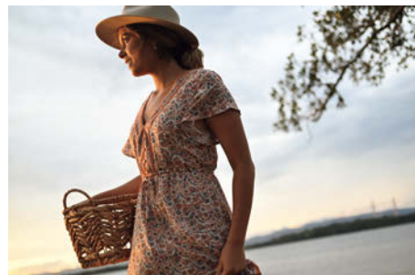
Z 5, 40mm, 1/1600秒, f/2, WB: オート1, ISO: オート(ISO 1600)

AF駆動には、新開発の小径・高トルクのSTM（ステッピングモーター）を採用しています。高速・高精度なAF制御により、とっさのスナップや動いている人物のポートレートなども快適に撮影可能。レンズボディの小型化やAFの静音化にも貢献しています。