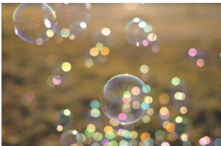
Z 5, 40mm, 1/1600秒, f/2, WB: オート1, ISO: 100

開放F値2の明るさと9枚の絞り羽根により、柔らかく自然なボケが得られます。光源や光に照らされた被写体がきれいな玉ボケとなり、主要被写体をより印象的に描写可能。ポートレートはもちろん、テーブルフォトや街角のスナップ撮影など、多彩なシーンで活躍します。