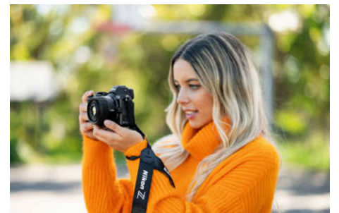
多彩なシーンに対応できて、持ち歩きもラクラク。