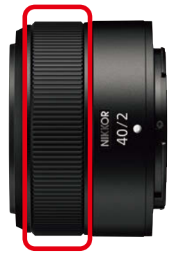
コントロールリングを搭載