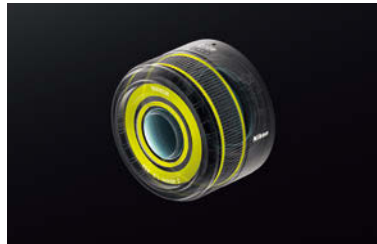
黄色 : シーリング部分