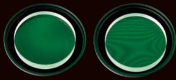
ARCREST II 他社製保護フィルター (同等品クラス)

● ARCREST IIの画像は同等性能のARCREST PROTECTION FILTERのものです。