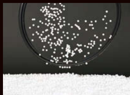
ARCREST 帯電防止コート無し