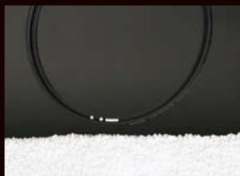
ARCREST II 帯電防止コート有り 金属製のフレームが帯電する場合があります。

新たに帯電防止コートをフィルター両面に採用。静電気を帯びにくくすることで、ホコリやゴミのフィルターへの吸着を防止します。