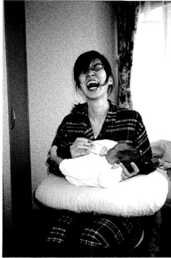
はじめてのミルクはどんな味？