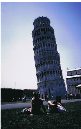
まっすぐじゃなくて、いいじゃない