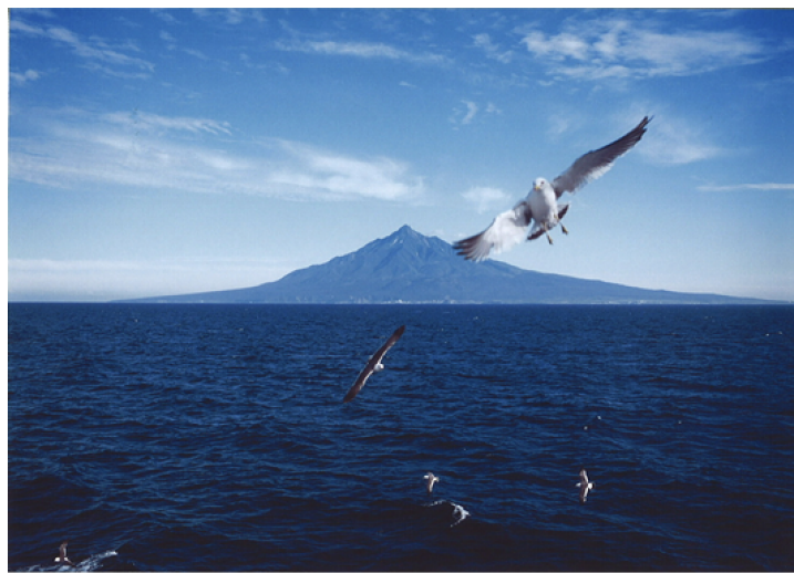
利尻富士とカモメ