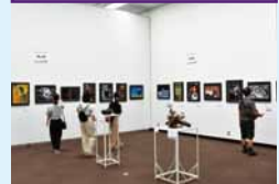
全国の写真部からの力作を、多くの方々にご覧いただきました。