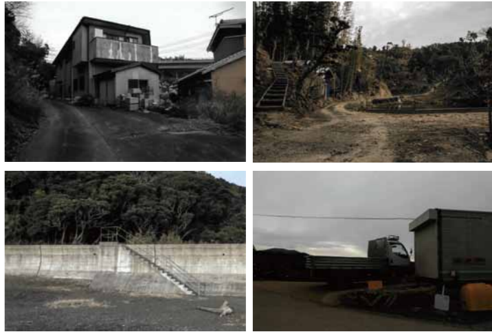
「42」萩原 律 [和歌山県立神島高等学校]