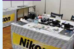
関連メーカーの展示ブースで、最新のカメラを体験してもらいました。