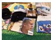
会場では写真集やグッズも販売!