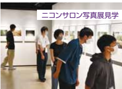
ニコンサロン写真展見学