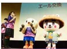
来年は鹿児島県で会いましょう!