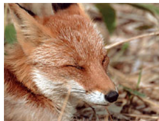
目の前までよっても逃げなかったというキタキツネ。リラックスしているのがわかる。

やっぱり人物ですね。家族や身近な人はいつも撮っていますけど、もっともっといろいろな人を撮ってみたいです。