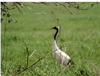
タンチョウ。ちょうど羽を羽ばたかせたカットもタイミングよく撮影に成功したとか。