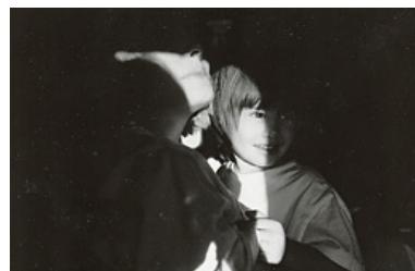
麻世さんお気に入りの一枚。

写ってずっと……一生残しておけるものだと思うんですよ。僕はビデオを撮らないんですよ。大きくなって見た時に、映像よりもその瞬間を写した一枚の写真の方が感動する気がするんです。そう思って撮り続けているんですけど、本人たちはそれに応え